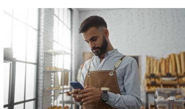
Rivendita al dettaglio