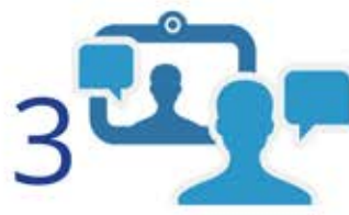
Gặp gỡ và hợp tác