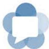
Tham gia từ Web chỉ từ 1 cú nhấp chuột

Trình bày và cộng tác với nhóm của bạn bằng cách chia sẻ màn hình máy tính