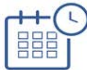
Không bao giờ bỏ lỡ hội nghị

Tham gia các cuộc họp từ trình duyệt Chrome hoặc Firefox chỉ với 1 cú nhấp chuột, không cần tải về phần mềm hoặc plugin