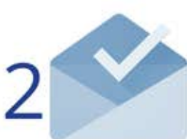
Mời người tham gia