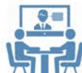
Phòng hội nghị hợp nhất

Tích hợp lập lịch trình để nhắc nhở người tham dự và tự động gọi/ nhắc nhở người tham dự tại thời điểm bắt đầu