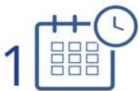
Lập kế hoạch hoặc bắt đầu 1 cuộc họp