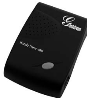
HandyTone 286 & HandyTone 486

Grandstream Networks, Inc., 1297 Beacon St., 2 nd Flr, Brookline, MA 02446 USA Tel: (617) 566-9300, FAX: (617) 249-1987