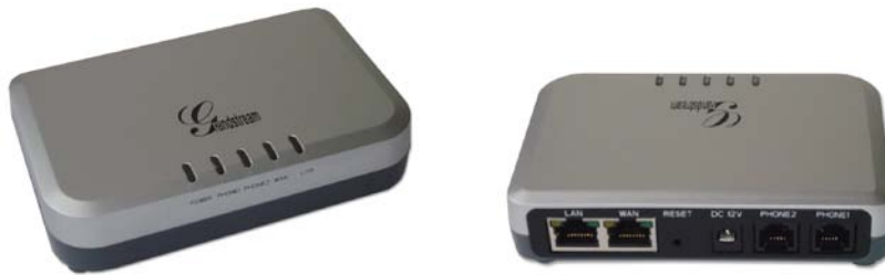
HandyTone 502 & HandyTone 503

P/N: 418-02010-10 Dokument Versionsnummer: 1.0