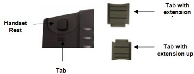
Figure 4: Mise en place de l'onglet pour le montage du téléphone au mur