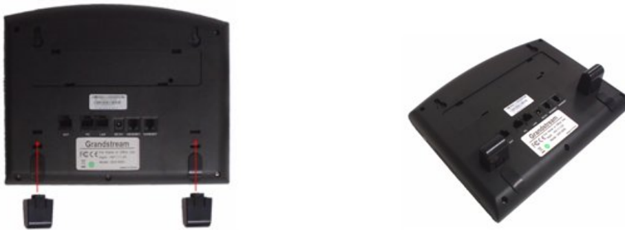
Figure 2: Fixation des supports de montage mural au GXP200

Pour monter le téléphone sur le mur, placez les deux dispositifs de fixation murale fixes sur le mur, accrocher l'arrière du téléphone aux cintres.