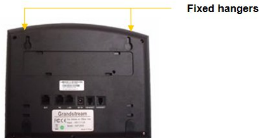
Figure 3: Localisation des dispositifs de fixation murale pour le GXP200

Pour utiliser l'appareil, retirer la languette (extension vers le bas) de l'appareil berceau, tournez l'onglet et branchez-le dans la fente d'extension jusqu'à tenir le combiné.